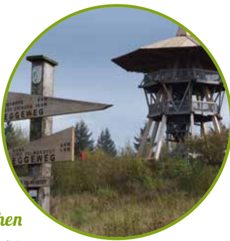
H Hermannsdenkmal, Berlebeck Forelle, Externsteine

Wer wandern will, sucht Qualität: Bestens ausgezeichnete Wege, einladende gastliche Häuser entlang der Route, komfortable Quartiere und viele Erlebnisse. Da locken die Hermannshöhen: 220 km, die drei Ferienregionen verbinden. Sie wandern bestens markiert mit einem „H“ am Hermannsweg und dem „X1“ am Eggeweg oder auf Themenwanderungen mit den 14 Tourertipps auf und an den Hermannshöhen. www.hermannshoehen.de