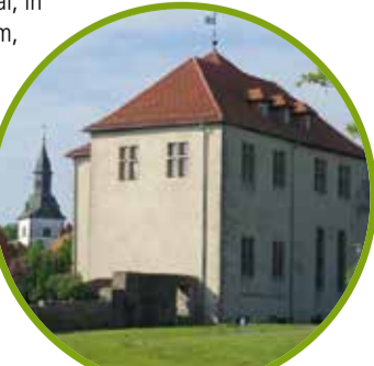
H Horn, Marktplatz

Der Besuch des stadtgeschichtlichen Museums bietet Gelegenheit, Geschichte sowohl von innen als auch von außen zu erleben. Die Räume des Museums befinden sich in der Burg Horn, einem der ältesten Wohnsitze der Edelleute zur Lippe. Die Abteilungen des Museums präsentieren die Stadt-, und Wirtschaftsgeschichte von Horn. Im roten Saal, in einem für Kinder gestalteten Erlebnisraum, wird die Burggeschichte anschaulich präsentiert. Öffnungszeiten: 03. April – 8. November Freitags, samstags und sonntags von 14 – 17 Uhr Weitere Öffnungszeiten auf Anfrage. Führungen ganzjährig buchbar. www.burgmuseum-horn.de