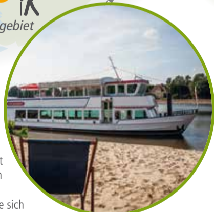
H Freizeitzentrum SchiederSee

SchiederSee – Freizeit. Feier. Vergnügen. Der SchiederSee liegt malerisch in einem Tal, ist 3,5 km lang und von einem 8 km langen Wanderweg umgeben. Setzen Sie sich gemütlich in einen Strandkorb und lassen Sie die Seele baumeln! Fahren Sie mit den lustigen Motiv-Tretbooten oder dem Rundfahrtschiff MS SchiederSee! Die Kleinen vergnügen sich in der Zeit im Familienpark Funstastico mit seinen zahlreichen Attraktionen wie dem Riesenrad, dem doppelten SkyDive oder dem großen Spielsee. Im Restaurant Breitengrad schlemmen Sie nach Herzenslust und genießen den Blick auf das Wasser. www.schiedersee.de