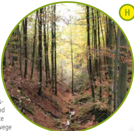
Naturpark Teutoburger Wald Eggegebirge

Natur in Hülle und Fülle, eindrucksvolle Landmarken, eine malerische Mittelgebirgslandschaft mit einer hohen Dichte an naturkundlichen und kulturgeschichtlichen Highlights – das ist der Naturpark Teutoburger Wald/Eggegebirge. Die vielfältigen Landschaftsräume und Waldgebiete im Naturpark sind Rückzugsgebiete für seltene und bedrohte Tierarten. Ausgewählte Familienwanderwege und zertifizierte Qualitätswege führen durch eine malerische Landschaft. Hier können Sie Natur mit allen Sinnen erleben. www.naturpark-teutoburgerwald.de