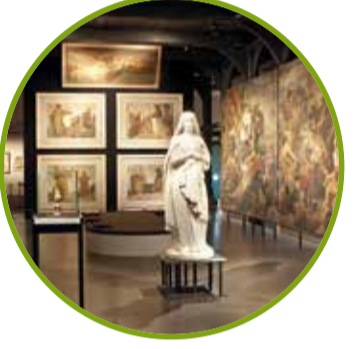
H Landesmuseum | Rosental

Das größte Regionalmuseum im Teutoburger Wald liegt direkt am Detmolder Burggraben im Zentrum der Residenzstadt Detmold, mit Abteilungen zu den Themen Naturkunde, Ur- und Frühgeschichte, Mythos Varusschlacht, Landes- und Kulturgeschichte, Kulturen der Welt sowie wechselnden Ausstellungen. Öffnungszeiten: Di – Fr: 10 – 18 Uhr, Sa – So und feiertags: 11 – 18 Uhr Montags, 01.05. geschlossen www.lippisches-landesmuseum.de