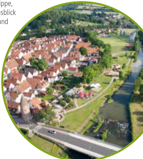
H Lügde, Markt

Ein Besuch Lügdes verspricht Erholung und Erlebnis zugleich. Die historische Altstadt mit ihren schönen Fachwerkhäusern, den gemütlichen Gassen und der Stadtmauer samt Wehrtürmen werden Sie begeistern. Ein echter Geheimtipp ist die romanische Kilianikirche aus dem 12. Jahrhundert. Am Rande der Altstadt liegt der Emmerauenpark. Die Parklandschaft am Ufer der Emmer mit großem Abenteuerspielplatz, dem „Emmer Beach“ und Café eignen sich optimal für eine kleine Auszeit. Die abwechslungsreiche Landschaft Lügdes lädt auf verschiedenen Themenwegen zu ausgiebigen Wander- und Radtouren ein. Vom Köterberg, der höchsten Erhebung in Lippe, genießen Sie den besten Ausblick auf den Teutoburger Wald und das Weserbergland. Kennen Sie schon den Osterräderlauf? Dieses einzigartige Brauchtum, das alljährlich am Ostersonntag stattfindet, sollten Sie unbedingt mal erlebt haben. www.luegde.de