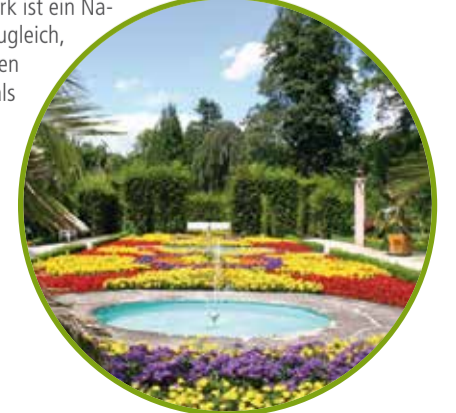
H Bad Pyrmont, Markt

Der historische Kurpark, eine Mischung aus streng barockem Alleensystem und englischem Landschaftsgarten, ist das Schmuckstück von Bad Pyrmont. Der Palmengarten ist das außergewöhnliche Herzstück des Kurparks und zugleich die nördlichste Palmengartenanlage Europas. Der 17 ha große Kurpark ist ein Naturerlebnis und Ruhezone zugleich, dient aber auch vielen großen Open Air Veranstaltungen als beeindruckende Kulisse. Öffnungszeiten: April – Oktober: täglich 8 – 22 Uhr Hunde dürfen leider nicht in den Kurpark. www.badpyrmont.de