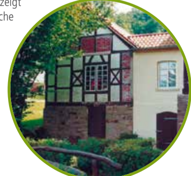
H Schieder, Pyrmont Straße (kurzer Fußweg)

Die restaurierte Plöger'sche Papiermühle präsentiert sich heute als ein äußerst anschauliches Museum für die Darstellung der Papierproduktion um 1900. Es zeigt die fast komplett erhaltene technische Anlage in den Produktionsräumen. Öffnungszeiten: Auf Anfrage unter 05282 60194 www.papiermuehle-ploeger.de