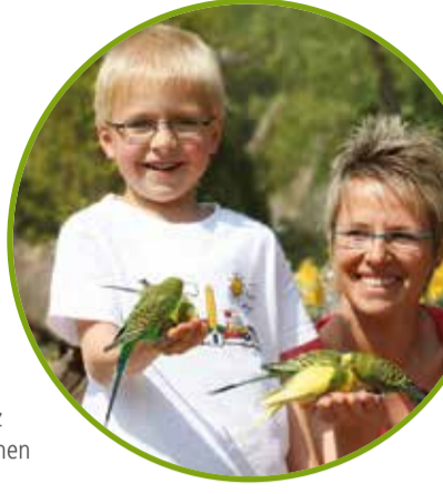
H Vogelpark | Heiligenkirchen Mitte (Fahrtrichtung Detmold)

Am Fuße des Hermannsdenkmals befindet sich der Vogelpark Heiligenkirchen. Dort erwartet Sie in Volieren und Freigehegen eine große Auswahl einheimischer und exotischer Vogelarten. Eine einmalige Kombination aus Flora und Fauna und Lernen mit Spaß. Die besondere Zooschule in freier Natur und ein Abenteuerspielplatz bieten Ihnen und Ihren Kindern einen abwechslungsreichen Besuch. Öffnungszeiten: März – November: täglich 9 – 18 Uhr (Einlass bis 17.30 Uhr), 0 täglich 15 Uhr „Füttern mit dem Tierpfleger“ www.vogelpark-heiligenkirchen.de